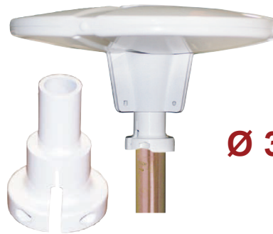
manchon pour mât \varnothing 30 / 32 mm (fourni)