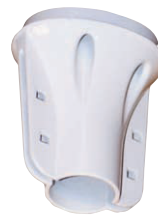
manchon pour mât \varnothing 30 / 32 mm (fourni)