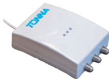
Livrées avec amplificateur externe 2 sorties multi alimentations 5 V= ou 12/24 V= ou 230 V~