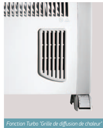
Fonction Turbo "Grille de diffusion de chaleur"