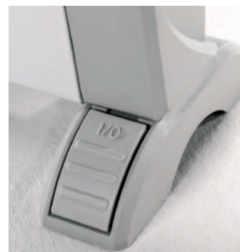
Interrupteur marche/arrêt au pied : l'astuce pratique pour ne pas avoir à se baisser