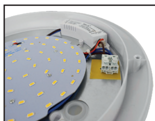
Connecteur rapide double entrée